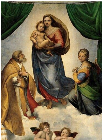
գ. Սիքստինյան Տիրամայրը (1512-1513 1508)